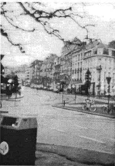
Gent, de stad van Brusselmans

"Ik ben die linkse, softe struisvogelpolitiek zo beu als kouwe pap. Als het argument zou zijn dat België niet vol is, dan zou ik ze wel gelijk geven, maar dan had ik het in the first place al niet gezegd. Als België vol is en negentig procent van de criminaliteit in han-